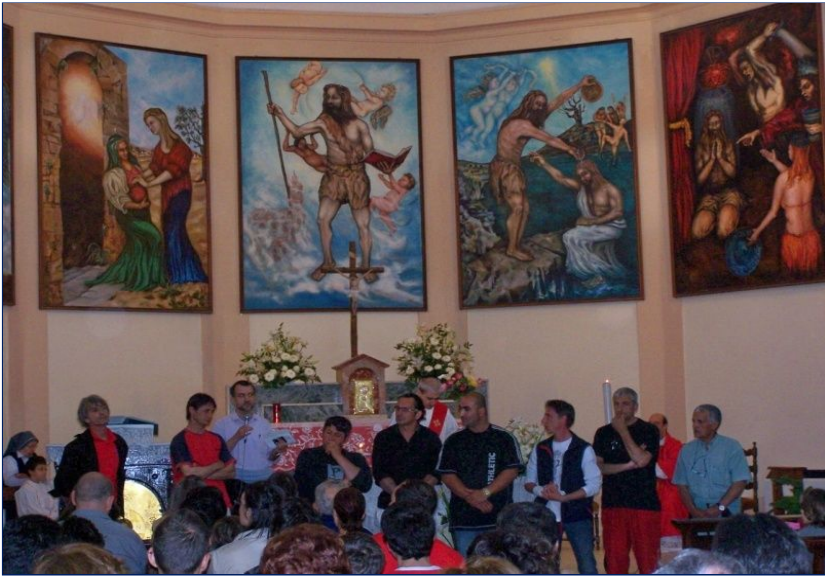
Momento di testimonianza degli ospiti della “Casa Madre del Perdono” presso la Parrocchia di Croce S.Savino (RN).