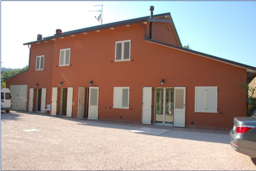
La nuova sede della Casa Madre del perdono, inaugurata il 11 luglio 2008 presso Taverna di Montecolombo (Rimini).