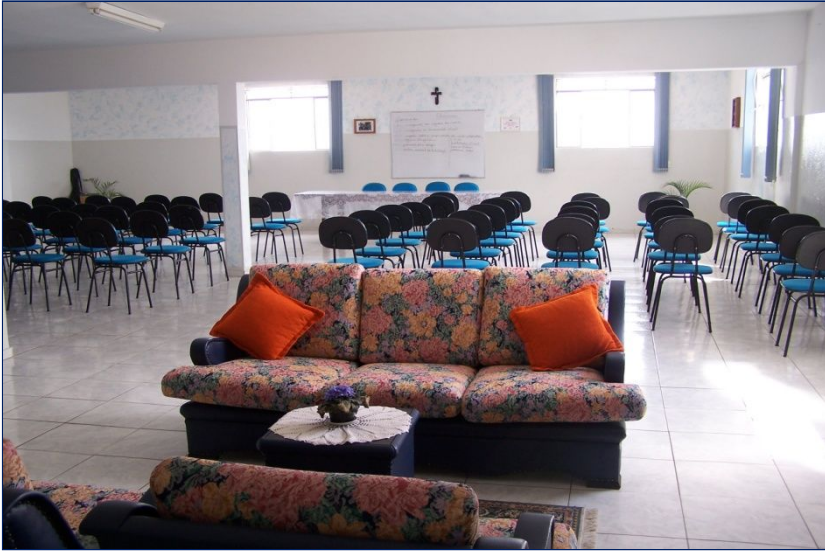
Sala convegni, incontri, momenti ricreativi.