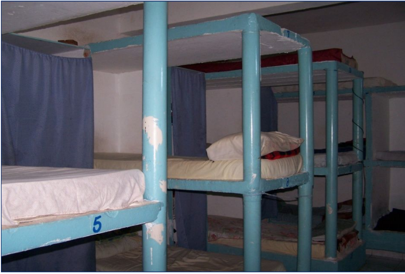
Camera del regime aperto.