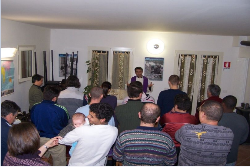
Santa Confessione e S. Eucaristia celebrate due volte il mese.