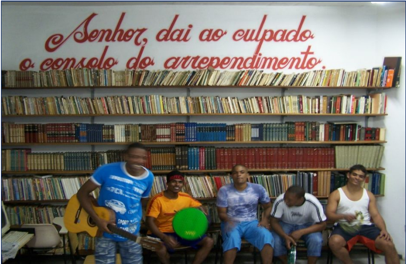
Biblioteca del carcere con una delle tante frasi scritte sulle pareti del presidio.