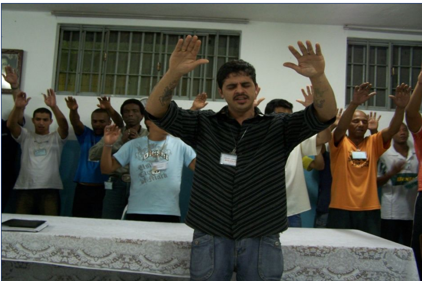
Momento di preghiera comunitario