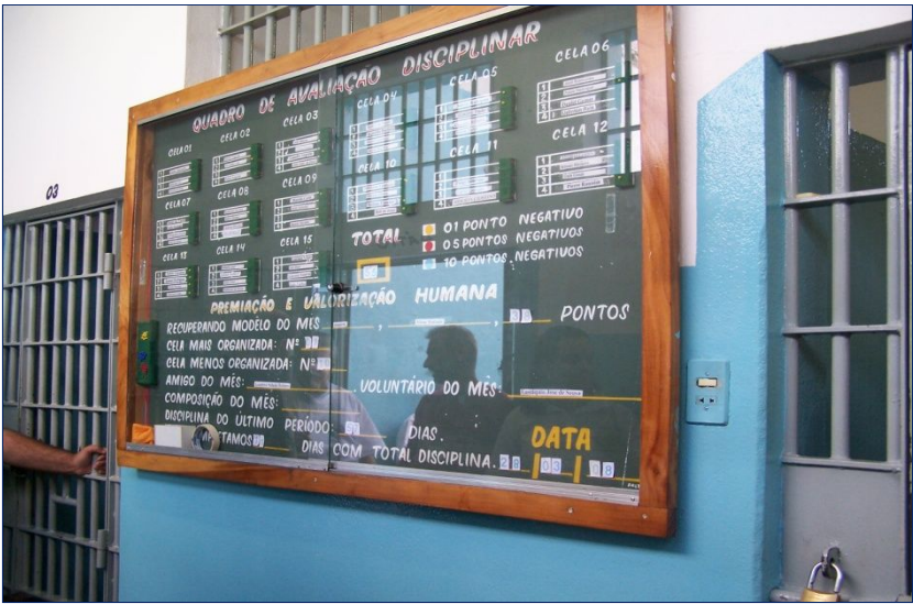
Tabella che quotidianamente formalizza il merito.