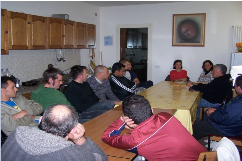
Momento di formazione attraverso testimonianze di esperienze forti: una missionaria in India racconta la sua esperienza.