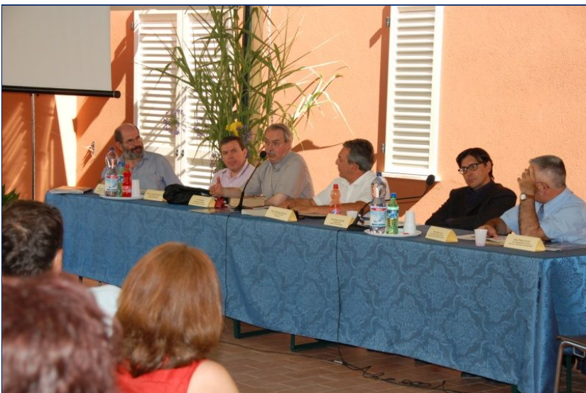
Inaugurazione della nuova sede con la partecipazione di S.E. Monsignor Francesco Lambiasi, Vescovo di Rimini e con varie autorità civili.