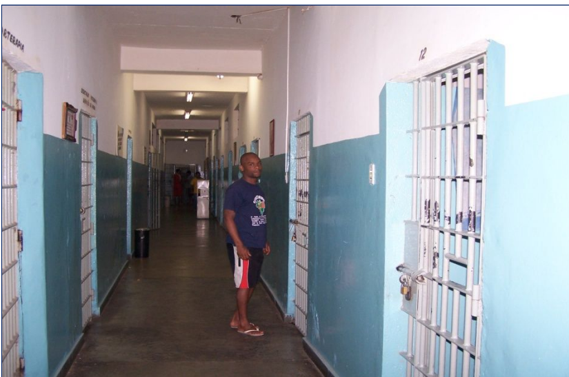
Sezione del regime chiuso, con 25 celle in uso.